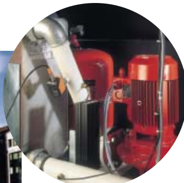
Abbildung ohne Isolierung (Standardmerkmal)

Dank der integrierten Komponenten ist die Installation problemlos und besonders kostengünstig durchzuführen, da die Anlage auf kleinstem Raum, auf dem Boden oder dem Dach aufgestellt werden kann und kein gesonderter Technikraum erforderlich ist.